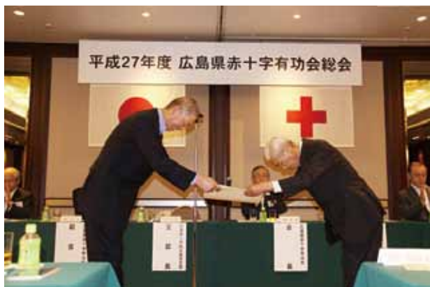
表彰伝達式（松電産業株式会社様）