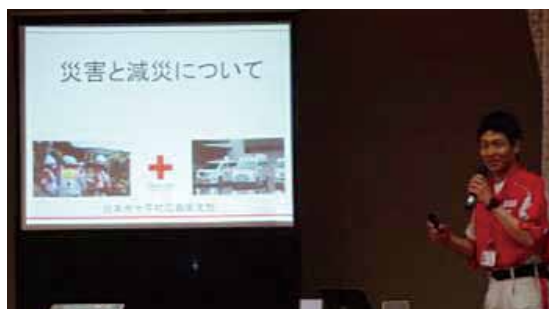
↑【災害と減災】講義の様子

まだ企業さまからのお声はなかなかかからない状況ですが、ご依頼があれば広島県支部職員が伺いますので、是非、赤十字をご活用ください。