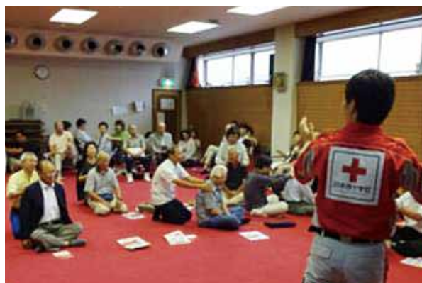
【応急手当等】リラクゼーション➡