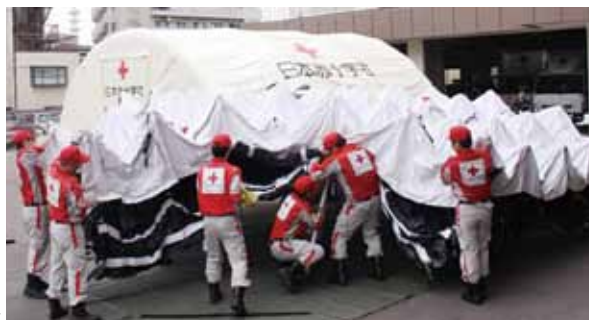
【救護資器材】ドラッシュテント設営➡

平成27年6月29日・30日の2日間にわたり、県内の赤十字施設の救護班要員・災害対策本部要員のスキルアップを目的とした「救護班要員研修会」を開催しました。