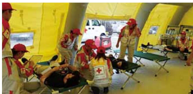
↑【総合実技1】傷病者対応（救護所）