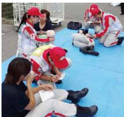
←【総合実技2】トリアージ