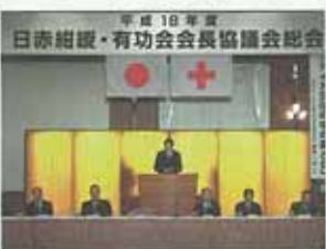
平成18年度 日赤紺綬・有功会会長協議会総会