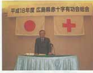
平成18年度 広島県赤十字有功会総会