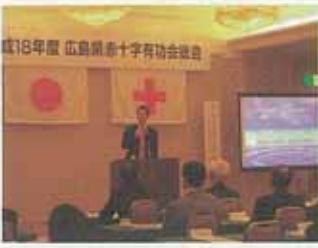
平成18年度 広島県赤十字有功会総会